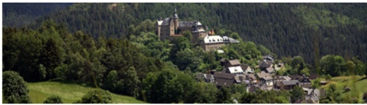
Zechen-Weg KC 74